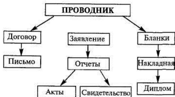
Рис. 1.5. Файловая структура

6. Скопируйте папку Акты в папку Диплом . Для этого в левом окне Проводника правой кнопкой мыши перетащите значок папки Акты и поместите его точно на значок Диплом и выберите команду Копировать .